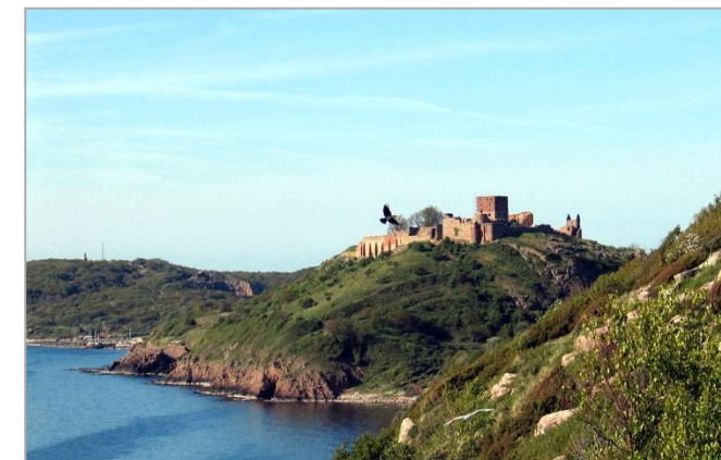
Hammershus - en af Nordeuropas bedst bevarede borgruiner.